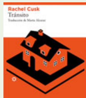
Tránsito Rachel Cusk

Memorias que narran la desastrosa historia de los Hollywood Brats. Aunque parecían destinados a la fama, se adelantaron a la eclosión del punk por pocos meses, fracasando estrepitosamente en el intento antes de caer en el olvido. Libro hilarante a cargo del frontman de un grupo que fue referencia para los Sex Pistols. Edita Contra.